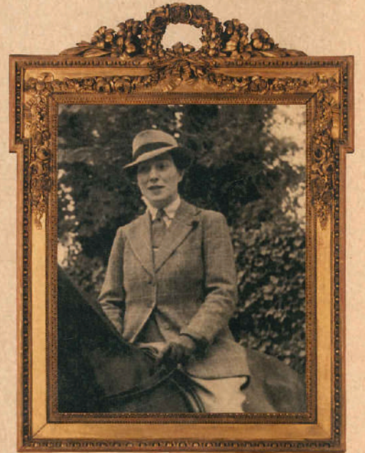
Béatrice de Camondo