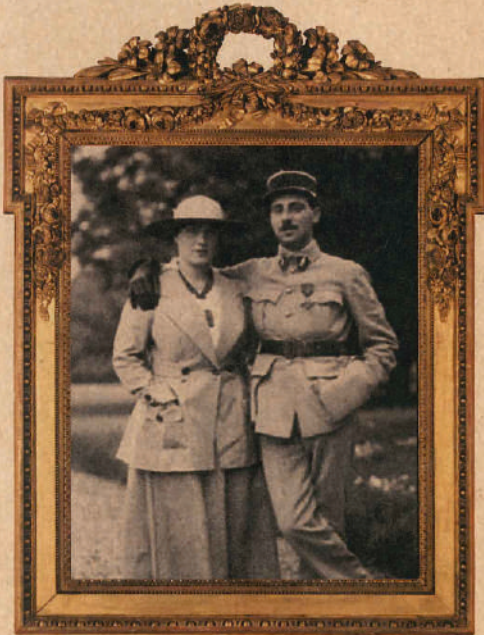
Béatrice de Camondo ve kardeşi Nissim de Camondo

Osmanlı İmparatorluğu döneminde bu varlıklı ailenin sosyal ve ekonomik hayata kattığı değerler, Paris'e göç ettikten sonra da devam etmiş ve günümüze kültürel miras olarak kalmıştır. Louvre Müzesi'ne bağışlanan empresyonist tablo koleksiyonları ve 18. yüzyıl sanat eserlerinin bir arada sergilendiği Musée de Camondo, dünyadaki tüm sanat severlere bıraktıkları en büyük mirastır.